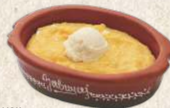
качамак - polenta with cheese and "kajmak" -