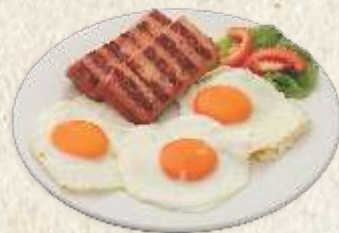
пржена јаја са вешалицом - fried eggs with smoked pork loin filet -