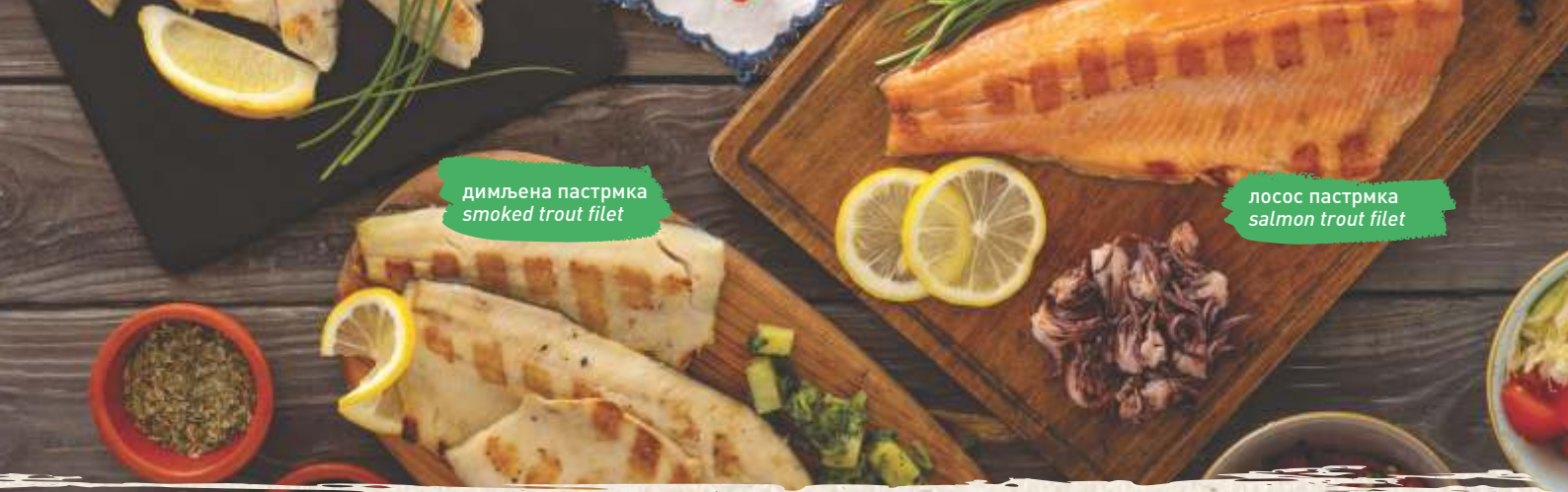
димљена пастрмка smoked trout filet