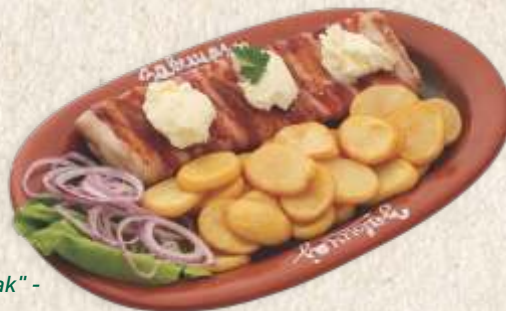
његушки стек - pork steak with "kajmak" -

Гурманска пљескавица 1690,00 - качкаваљ и сланина - gourmet "pljeskavica" - spicy minced meat with "kajmak" (400g)