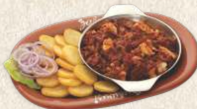
лесковачка мућкалица са пилећим филеом - chicken stew with vegetables & hot peppers -