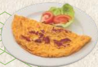
омлет са сувом говеђом пршутом - omelet with dry beef ham -