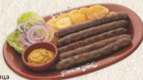
домаћа бела кобасица - fresh pork sausage -