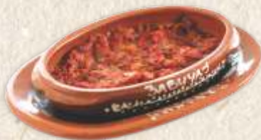
сатараш - mixed vegetables stew with hot peppers -