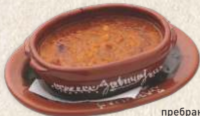
пребранац - baked beans -

- лесковачки - "urnebes" (150g) - cheese & chili flakes -