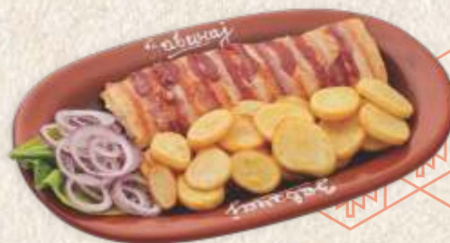
ролована пилетина - stuffed chicken filet -