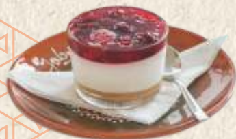
чизкејк - cheesecake -