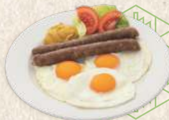
пржена јаја са кобасицом - fried eggs with white sausage -