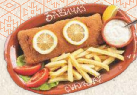
кнежева трака - "kneževa traka" steak -

Карађорђева шницла 1690,00 - поховани лас каре, пуњен кајмаком - "karađorđeva" steak - fried breaded pork loin filet stuffed with "kajmak" -