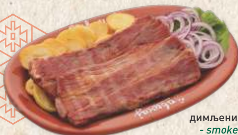
димљени свињски врат - smoked pork neck -

Домаћа бела кобасица 1190,00 - танка недимљена - pork sausage - non smoked (300g)