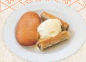
слатки тањир - sweet plate -