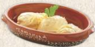
кајмак - "kajmak" -

- у маслиновом уљу - homemade cheese in oil (150g)