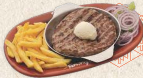
пљескавица на кајмаку - "pljeskavica" with "kajmak" -

Пљескавица на кајмаку 1570,00 - млади мионички кајмак - "pljeskavica" with "kajmak" - minced meat & onion with "kajmak" (300g)