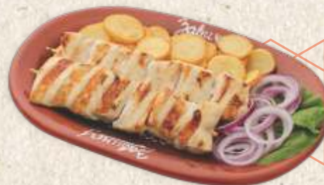
пилећи ражњићи - chicken skewer -