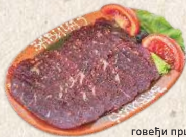
говеђи пршут - dry beef ham -

- са пилећим филеом - chicken stew with vegetables & hot peppers