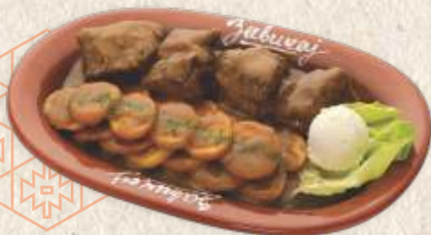
телеће печење - roasted veal in gravy -

Бифтек у уљу 2890,00 - маслиново уље и балзамико сирће - beef steak in oil - olive oil and aceto balsamico -