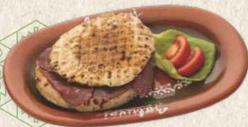
комплет лепиња са пршутом - baked flat bun with "kajmak", egg & dry beef ham -