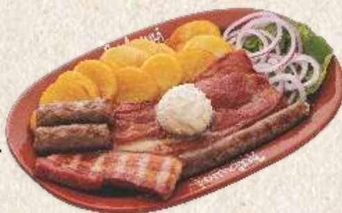
мешано месо "завичај" - mixed meat "zavičaj" -