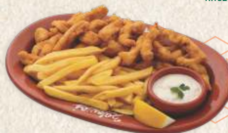
пилећи штапићи - chicken sticks -

Пилећи штапићи 1440,00 - поховани хрскави пилећи филе - chicken sticks - fried breaded chicken filet -