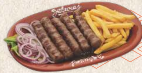
Ћевапи - "ćevap" -

Ћевапи 1440,00 - 5 комада - 1/2 "ćevap" - minced meat finger - 5 pcs (300g)