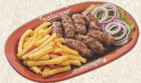
занатски ћевапи - "zanatski ćevap" -

Занатски ћевапи 1370,00 - зачињени луком - "zanatski ćevap" - craft minced meat & onion (300g)