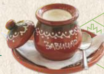
кисело млеко - homemade yogurt -