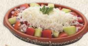
"шопска" салата - "šopska" salad -