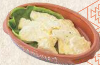
сјенички сир - homemade cheese in oil -