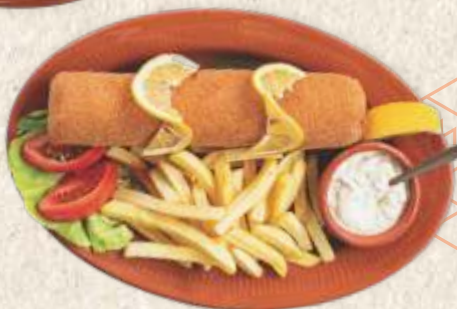
карађорђева шницла - "karađorđeva" steak -