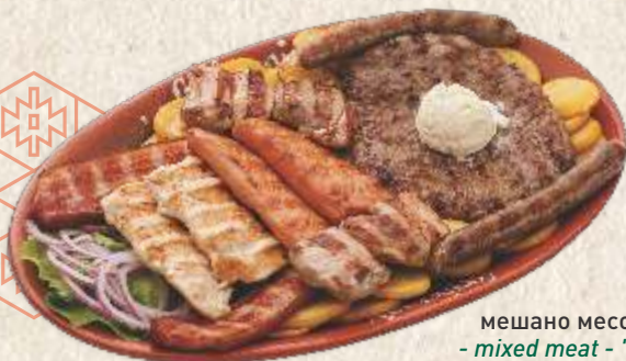
мешано месо "два гурмана" - mixed meat - "two gourmands" -

- "ćevap", sausage, smoked meat, homemade smoked pork bacon with "kajmak" (370g)