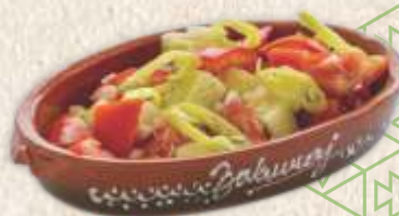
"српска" салата - "serbian" salad -