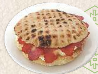
златиборски сендвич - baked flat bun with "kajmak" & dry beef ham -

Комплет лепиња са пршутом 740,00 - јаје, кајмак, претоп, говеђа пршута - baked flat bun with "kajmak", egg & dry beef ham