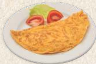
омлет са сиром - omelet with homemade cheese -