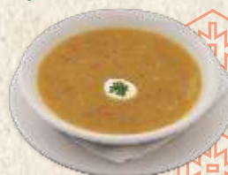
телећа чорба - thick veal soup -

- са поврћем и милерамом - thick veal soup