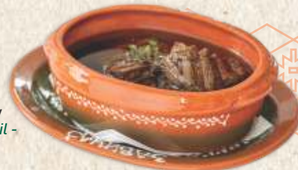
бифтек у уљу - beef steak in oil -