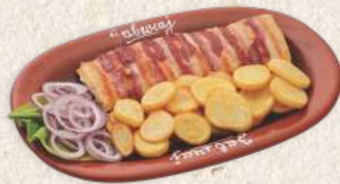
ролована пилетина - stuffed chicken filet -