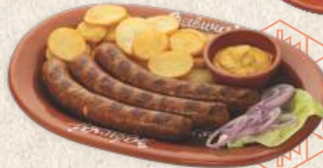
занатска димљена кобасица - craft smoked sausage -