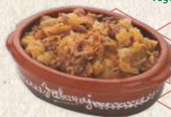
свадбарски купус - cooked sour cabbage -