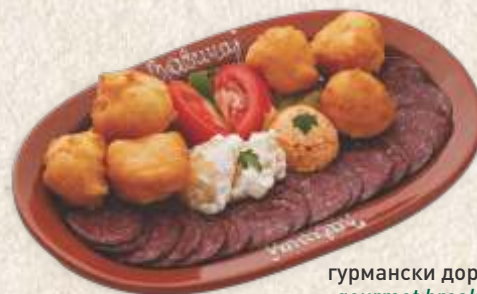
гурмански доручак - gourmet breakfast -