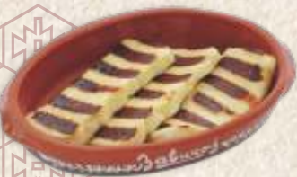
гриловани сир - grilled halloumi cheese -