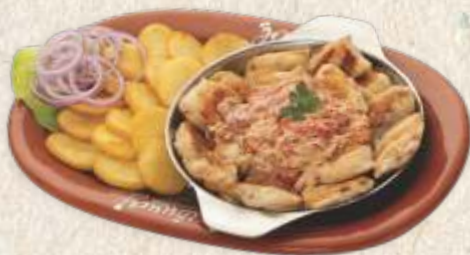
пилетина у паприка сосу - grilled chicken filet -