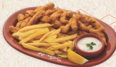
пилећи штапићи - chicken sticks -