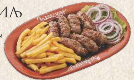
занатски ћевапи - "zanatski ćevap" -