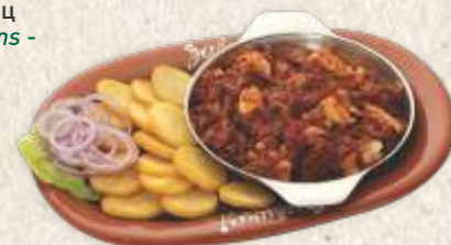
лесковачка мућкалица са пилећим филеом - chicken stew with vegetables & hot peppers -