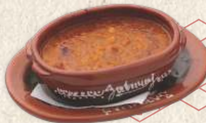
пребранац - baked beans -