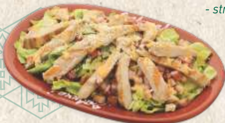
са пилећим филеом - chicken breast filet salad -