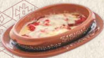
паприка са сиром - baked red peppers with cheese -