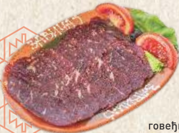
говеђи пршут - dry beef ham -

- "kajmak", bell peppers in sour cream, "ajvar", "urnebes" -