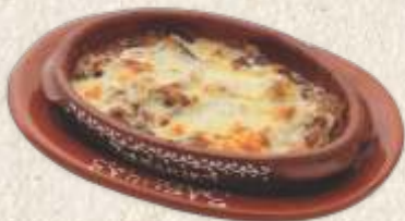
цепкана ребарца на кајмаку - pulled smoked pork ribs on "kajmak" -