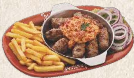
швајсовани ћевапи - "švajsovani ćevapi" -