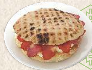
златиборски сендвич - baked flat bun with "kajmak" & dry beef ham -