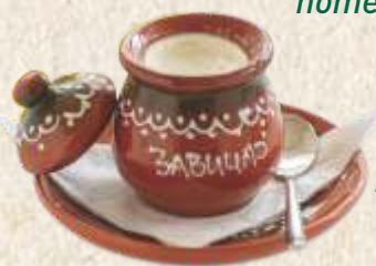
кисело млеко - homemade yogurt -