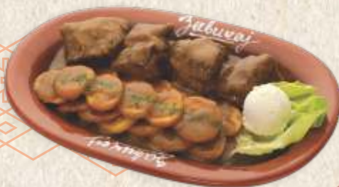
телеће печење - roasted veal in gravy -