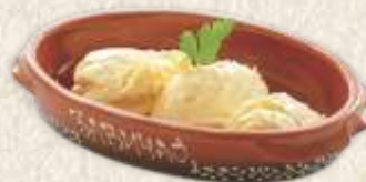
кајмак - "kajmak" -