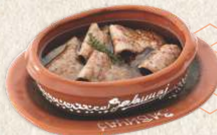
рамстек у уљу - beef strip steak in oil -