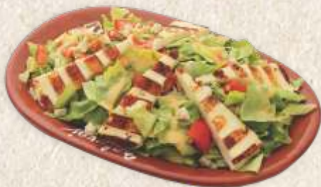
са мирочким сиром - grilled halloumi cheese salad -