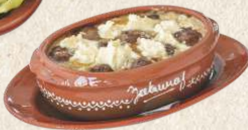
боемски ћевап за две особе - bohemian "čevap" for two -