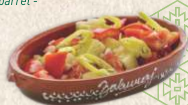
"српска" салата - "serbian" salad -