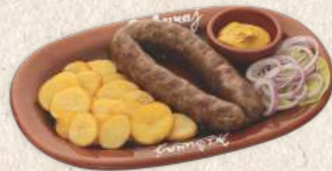
бифтек кобасица - beef steak sausage -