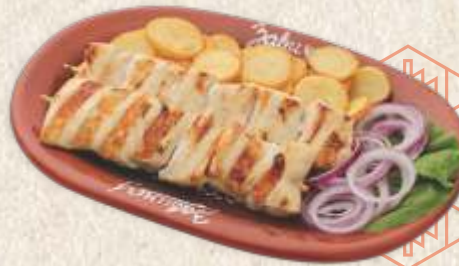
пилећи ражњићи - chicken skewer -