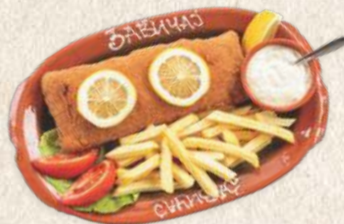
кнежева трака - "kneževa traka" steak -