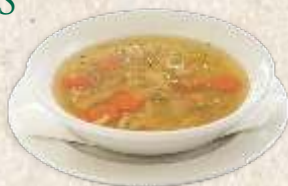
домаћа супа - homemade noodle soup -

Телећа чорба - са поврћем и милерамом - thick veal soup 490,00