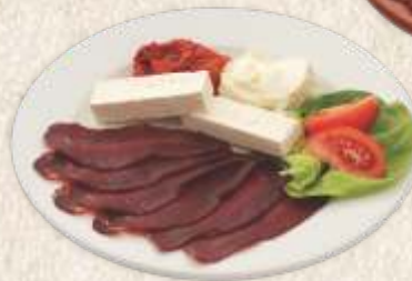
мало мезе - small starter -