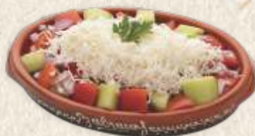
"шопска" салата - "šopska" salad -