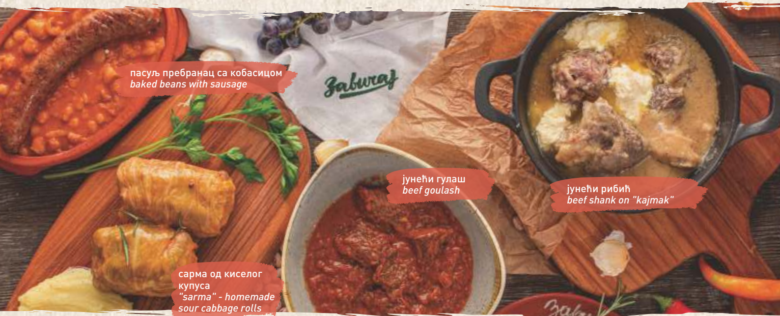
пасуљ пребранац са кобасицом baked beans with sausage