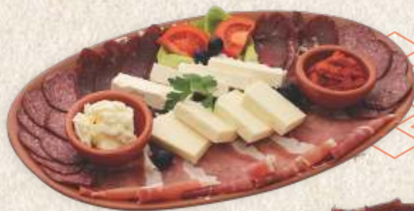
мезетлук за четворо - starter for four -