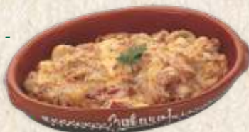
паприка сос - red peppers in "kajmak" sauce -