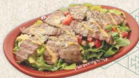
са слајсованим рамстеком - strip steak salad -