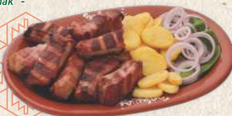
ребарца на буковини - traditional smoked pork ribs -