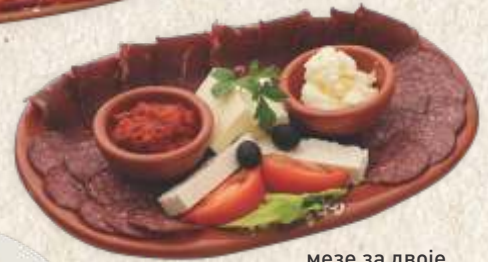
мезе за двоје - starter for two -