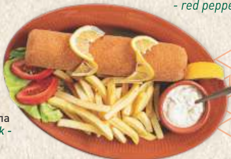
ћараћорђева шницла - "karađorđeva" steak -