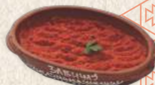
ајвар - "ajvar" -