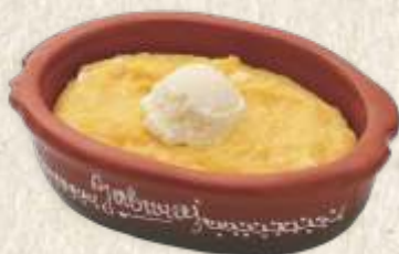
качамак - polenta with cheese and "kajmak" -