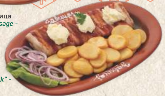
његушки стек - pork steak with "kajmak" -

Његушки стек 1990,00 - ролован сланином, пуњен качкаваљем и његушком пршутом, преливен кајмаком - pork steak with "kajmak" - rolled with bacon, stuffed with caciocavallo & smoked dry pork ham -