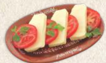
мирочки сир - halloumi cheese -