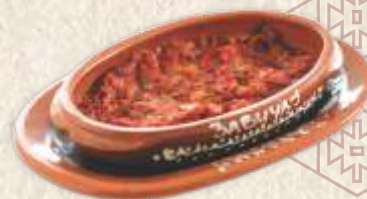
сатараш - mixed vegetables stew with hot peppers -

Гриловани сир 890,00 - мирочки шкрипавац - grilled halloumi cheese