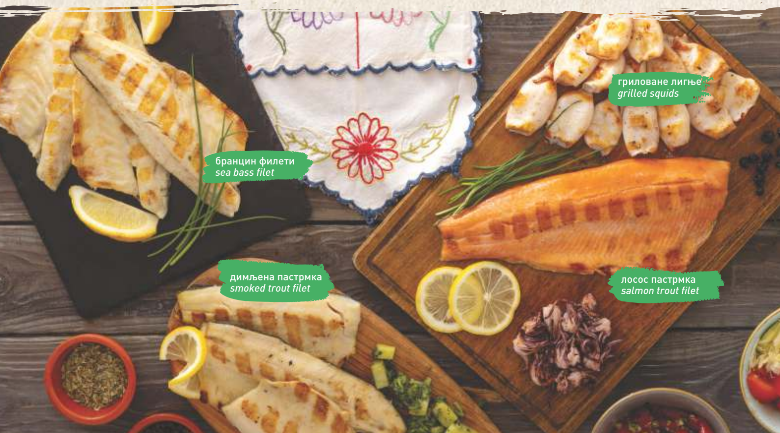
бранцин филети sea bass filet