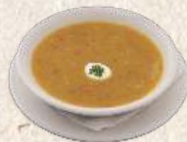
телећа чорба - thick veal soup -

Домаћа супа - од шупљих јунећих костију и пилећих груди - homemade noodle soup 420,00