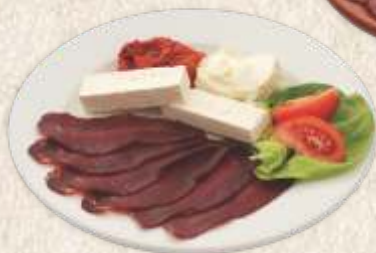
мало мезе - small starter -