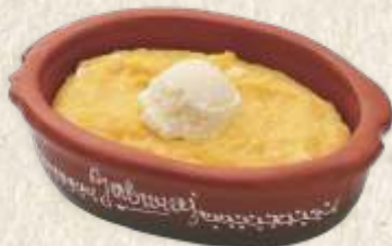
качамак - polenta with cheese and "kajmak" -