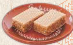
старинске обланде са орасима - "oblanda" -