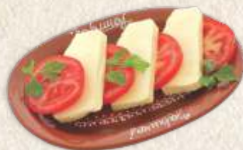
мирочки сир - halloumi cheese -