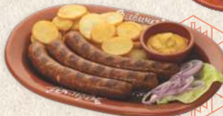
занатска димљена кобасица - craft smoked sausage -