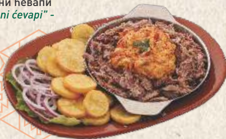
цепкана ребарца - pulled smoked pork ribs -