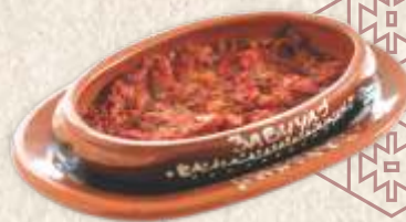
сатараш - mixed vegetables stew with hot peppers -

Гриловани сир 790,00 - мирочки шкрипавац - grilled halloumi cheese