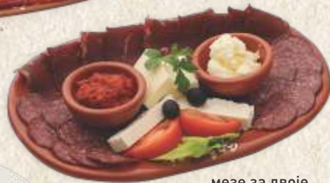
мезе за двоје - starter for two -