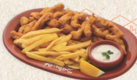
пилећи штапићи - chicken sticks -