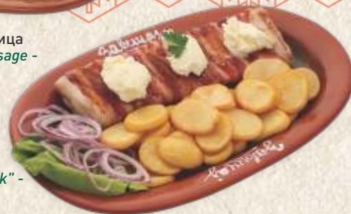
његушки стек - pork steak with "kajmak" -