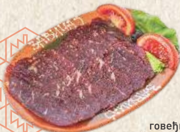
говеђи пршут - dry beef ham -

- "kajmak", bell peppers in sour cream, "ajvar", "urnebes" -