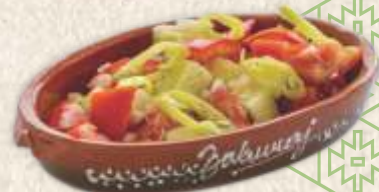
"српска" салата - "serbian" salad -

"Српска" салата 420,00 - парадајз, краставац, лук, љута папричица - "serbian" salad (300g) - tomato, cucumber, onion, chili pepper -