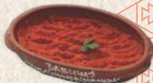
ајвар - "ajvar" -