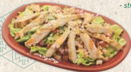
са пилећим филеом - chicken breast filet salad -