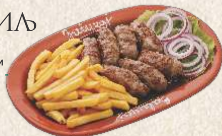
занатски ћевапи - "zanatski ćevap" -