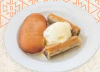
слатки тањир - sweet plate -