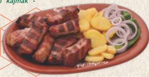
ребарца на буковини - traditional smoked pork ribs -