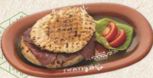
комплет лепиња са пршутом - baked flat bun with "kajmak", egg & dry beef ham -