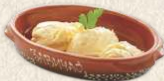
кајмак - "kajmak" -