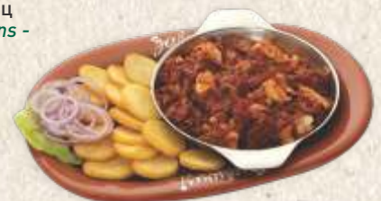
лесковачка мућкалица са пилећим филеом - chicken stew with vegetables & hot peppers -