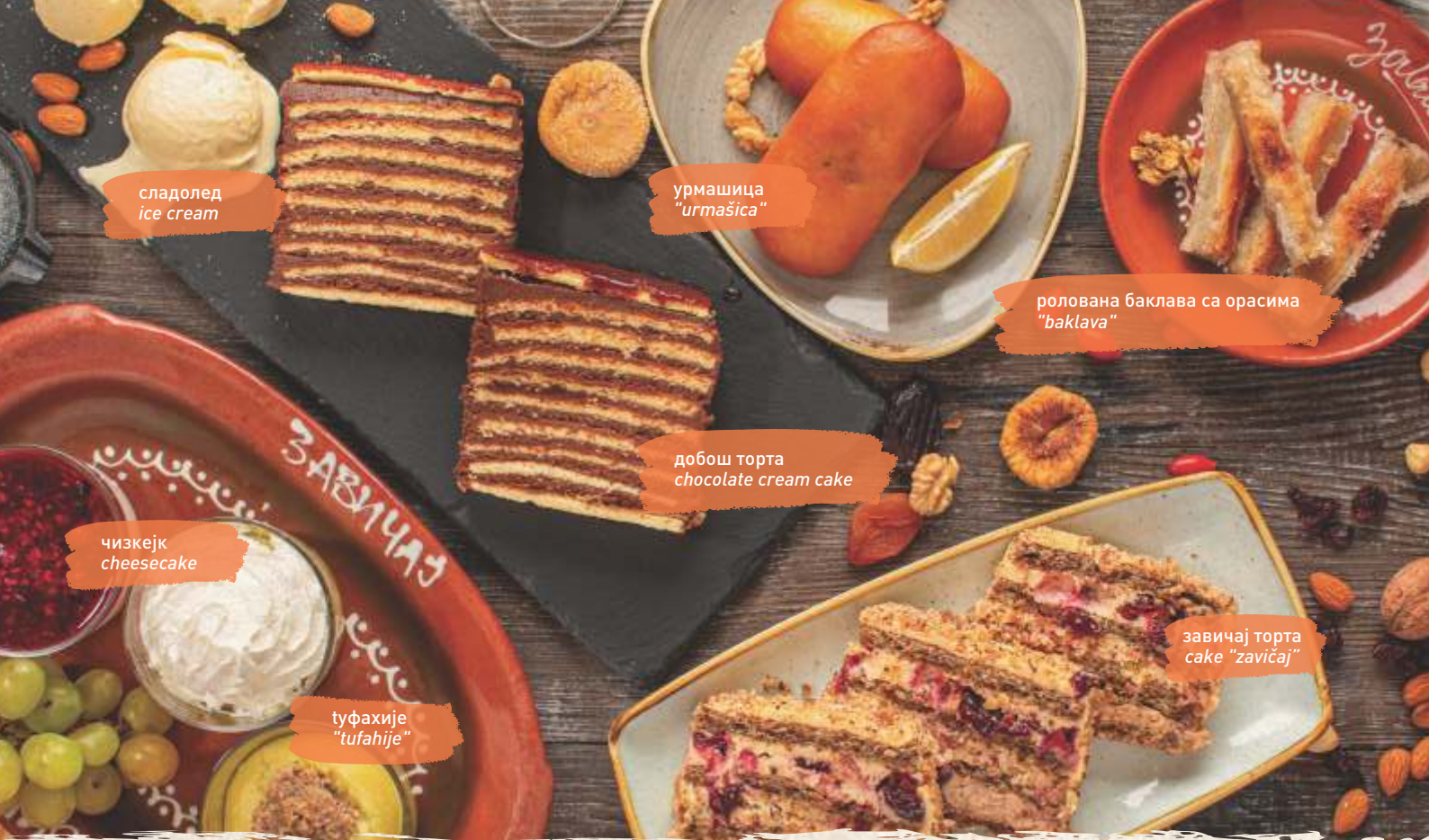
сладолед ice cream