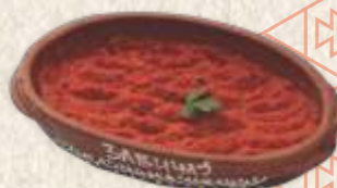
ајвар - "ajvar" -