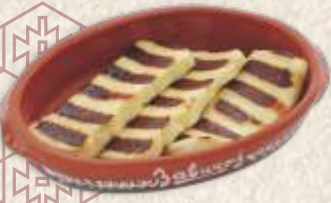
гриловани сир - grilled halloumi cheese -