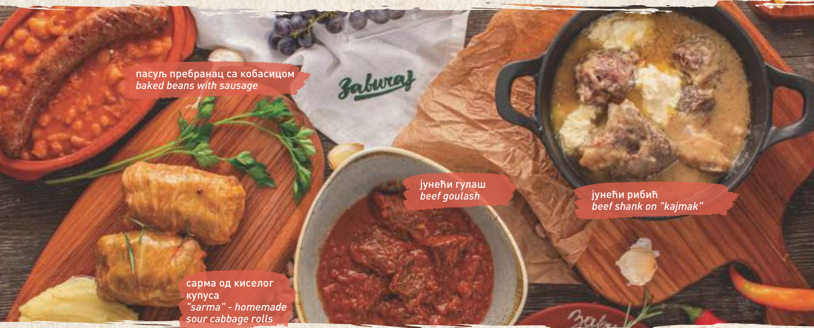
пасуљ пребранац са кобасицом baked beans with sausage