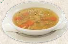
домаћа супа - homemade noodle soup -

Телећа чорба - са поврћем и милерамом - thick veal soup 490,00