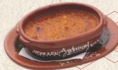
пребранац - baked beans -