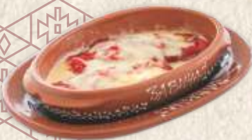
паприка са сиром - baked red peppers with cheese -